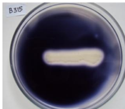
Gambar 2. Zona terang di sekitar koloni B. subtilis B315 pada uji hidrolisis pati