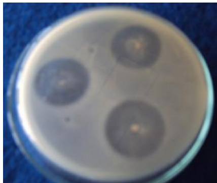
Gambar 1. Penghambatan B. subtilis B315 terhadap R. solanacearum

Angka yang diikuti oleh huruf yang sama dalam kolom yang sama menunjukkan tidak berbeda nyata pada uji Newman-Keuls 5%.