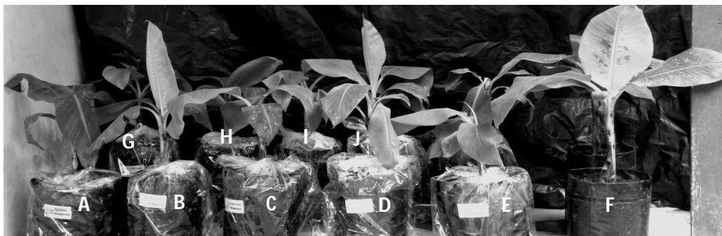
Gambar 5. Uji patogenesitas beberapa isolat R. solanacearum Phylotype IV pada tanaman pisang Kepok umur 4 bulan setelah aklimatisasi. (A) Aplikasi suspensi R. solanacearum Phylotype IV yang diisolasi dari permukaan caput T. minangkabau , (B) isolat R. solanacearum Phylotype IV dari dalam caput, (C) isolat R. solanacearum Phylotype IV dari permukaan abdomen, (D) isolat R. solanacearum Phylotype IV dari dalam abdomen, (E) isolat R. solanacearum Phylotype IV dari telur, (F) kontrol, (G) isolat R. solanacearum Phylotype IV dari larva, (H) isolat R. solanacearum Phylotype IV dari pupa, (I) isolat R. solanacearum Phylotype IV dari polen, dan (J) isolat R. solanacearum Phylotype IV dari nektar.