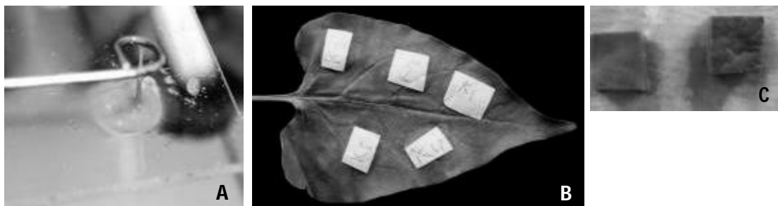
Gambar 4. Hasil uji Gram, reaksi hipersensitive, uji pektinase, dan uji patogenesitas koloni bakteri yang diisolasi dari T. minangkabau . (A) Hasil uji Gram koloni R. solanacearum Phylotype IV, (B) reaksi hipersensitif pada daun tanaman M. jalapa pada 48 jam setelah inokulasi (K1, koloni bakteri dari permukaan kepala; K2, koloni bakteri dalam kepala; K3, koloni bakteri permukaan abdomen; K4, koloni bakteri bagian dalam abdomen; dan K5, air steril), dan (C) uji pektinase pada potongan umbi kentang.