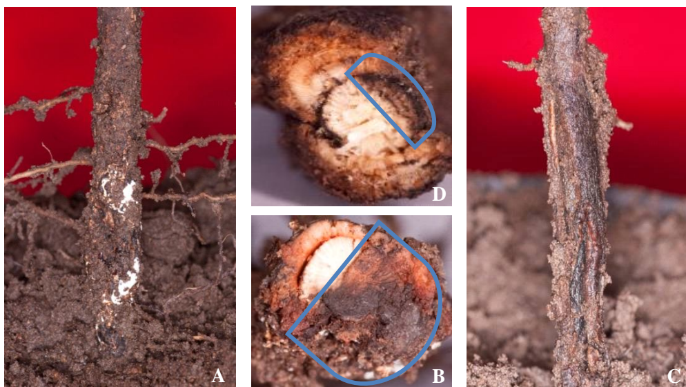
Gambar 4. Respon toleransi semai Polyalthia longifolia terhadap Ganoderma sp. isolat GD TP 2 48 minggu setelah inokulasi. (A) rhizomorf, (B) penampang melintang dan perlakuan kontrol, (C) rhizomorf, dan (D) penampang melintang.

& Daly, 2007) yang menyatakan bahwa P. indicus rentan terhadap penyakit busuk akar merah, meskipun sampai saat ini masih belum ada pustaka yang melaporkan bahwa di Indonesia sudah terjadi serangan Ganoderma sp. pada P. indicus . Reaksi senyawa fenolik sebagai respon ketahanan tanaman tidak muncul pada P. indicus dibandingkan P. longifolia yang menimbulkan reaksi senyawa fenolik.