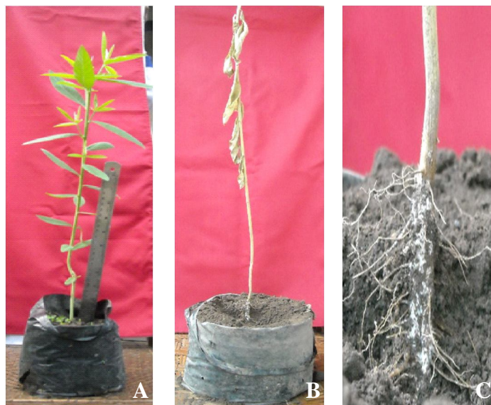
Gambar 2. Uji Postulat Koch Ganoderma sp. menggunakan tanaman indikator Crotalaria sp.. (A) Kontrol, (B) Diinokulasi dengan Ganoderma sp. (C) Rhizomorf jamur patogen pada pangkal batang dan perakaran.

Crotalaria sp. menunjukkan morfologi koloni yang sama dengan biakan murni Ganoderma sp. yang sebelumnya telah diinokulasi ke Crotalaria sp.