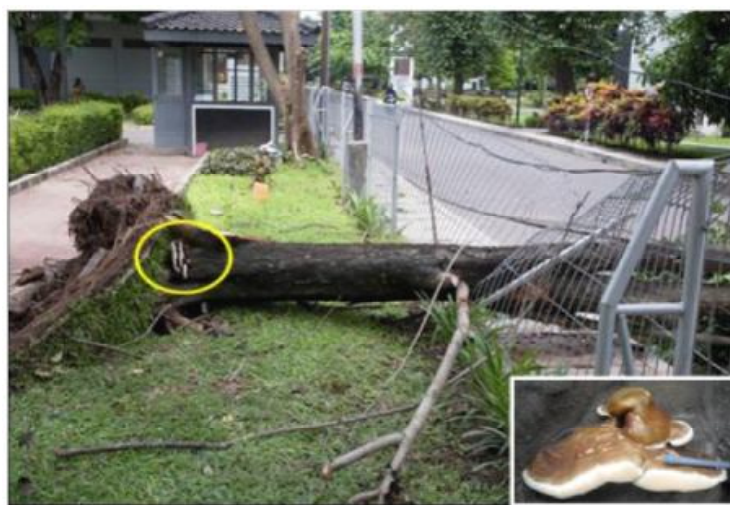
Gambar 1. Kerusakan Pterocarpus indicus akibat serangan Ganoderma sp. di kampus UGM.

Uji Postulat Koch. Pada minggu keenam setelah inokulasi Crotalaria sp. terdapat rhizomorf pada leher akar dan perakaran, serta tanaman uji mulai menunjukkan gejala kematian berupa layu (Gambar 2B dan 2C). Reisolasi rhizomorf jamur patogen dari leher akar