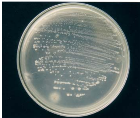
Gambar 2. Koloni BDB setelah inkubasi selama 48 jam