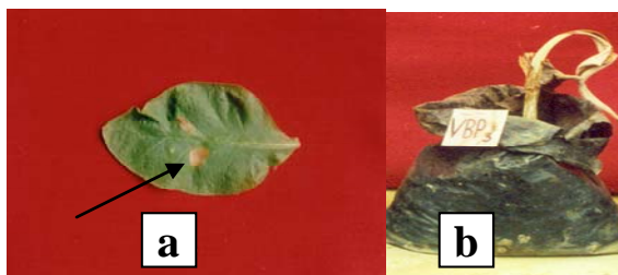
Gambar 3. a. Hasil positif pada uji reaksi hipersensitif (adanya daerah nekrotik) b. Hasil positif pada uji patogenesis