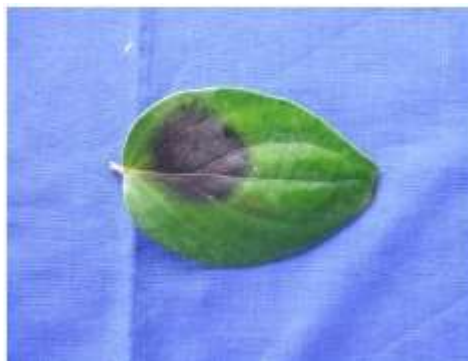
Gambar 3. Hasil uji patogenesis pada daun lada