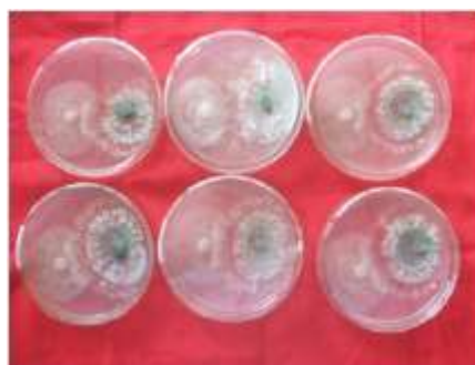
Gambar 4. Uji antagonisme Trichoderma spp. terhadap P. capsici dengan metode kultur ganda.

Trichoderma spp. yang diuji memiliki kemampuan penghambatan bervariasi yang terendah 19,028% dan yang tertinggi 29,762%. Kenyataan ini sangat mungkin terjadi, karena memang jamur Trichoderma spp. sangat mudah berkembang dan juga sangat tahan terhadap berbagai keadaan lingkungan yang tidak cocok (Thurston, 1992; Campbell, 1989; Tronsmo, 1996). Trichoderma spp. juga diketahui lebih toleran terhadap